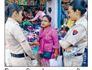
हिसार। महिला को जागरूक करती दुर्गा शक्ति टीम।

दीपावली पूर्व को शांति एवं सुरक्षा के साथ मनाए जाने के लिए जिला पुलिस ने पूरे शहर में सुरक्षा व्यवस्था को मजबूत किया है। शहर के प्रमुख बाजारों, सार्वजनिक स्थलों और धार्मिक स्थानों पर अतिरिक्त पुलिस बल की तैनाती की गई।