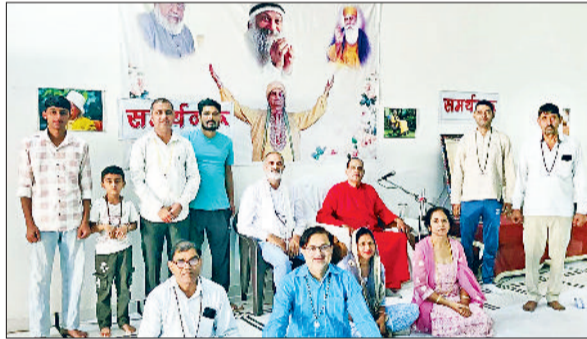
हिसार। कौशिक नगर स्थित ध्यान केंद्र में साधना करने पहुंचे साधक।