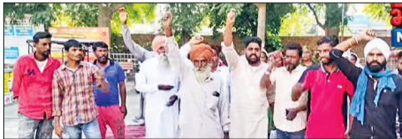
सिरसा। डबवाली के नागरिक अस्पताल में प्रदर्शन करते लोग।