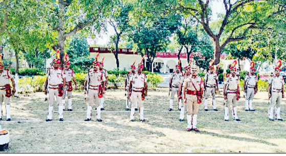
हिसार। परेड करते पुलिस के जवान।