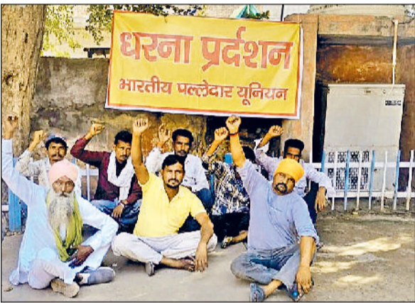
रतिया। घरने पर बैठे मण्डी के पल्लेदार।