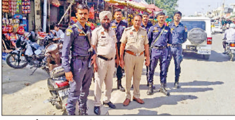
फतेहाबाद जिले के बाजारों में तैनात पुलिस टीमों।

■ त्योहार को लेकर जिले में सुरक्षा के पुख्ता प्रबंध