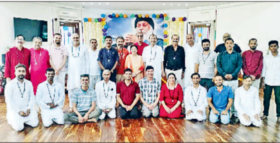
हिसार। ओशो ध्यान उपवन में आयोजित दिवाली ध्यान महोत्सव में उपस्थित साधक।

दीपावली के उपलक्ष्य में ओशो ध्यान उपवन में दिवाली ध्यान महोत्सव का आयोजन धूमधाम से किया गया। इस अवसर पर विभिन्न सत्र आयोजित करके ध्यान साधना का अभ्यास करवाते हुए दीपावली का सही अर्थ समझाया गया। इस दौरान साधकों को महारास में शामिल होने का भी अवसर मिला। इसके साथ ही