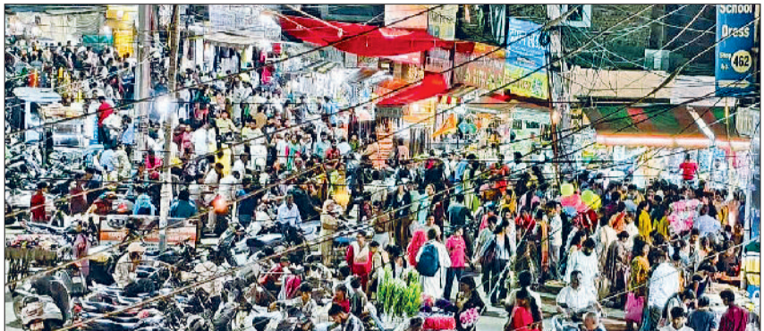
हिसार। दीपावली की पूर्व संध्या पर राजगुरु मार्केट में खरीदारी करती लोगों की भीड़।

दीपोत्सव की सभी तैयारियां पूरी कर ली गई है। सोमवार को लोगों के घरों व प्रतिष्ठानों में मां लक्ष्मी व गणेश की पूजा अर्चना होगी। कुबेर की भी पूजा का विधान है। रविवार को शहर में दीपावली की खरीदारी को लेकर लोगों की भारी भीड़ उमड़ी। राजगुरु मार्केट में इतनी अधिक भीड़ दी कि तिल रखने को जगह नहीं थी। बाजार में भीड़ को नियंत्रित करने के लिए पुलिस को कड़ी मशक्कत करनी पड़ी। पूजा के लिए लोगों ने लक्ष्मी-गणेश की प्रतिमा खरीदी है। दिवाली को लेकर लोगों ने रविवार को देर रात तक खरीदारी की। लोगों ने घरों की सजावट के लिए दीयों, मोमबत्ती, फूलों और गुलदस्तों के साथ रंग बिरंगी इलेक्ट्रॉनिक झालरों की भी खरीदारी की। इसके अलावा दिवाली उपहार देने के लिए लोगों ने मिठाई और गिफ्ट आइटम्स की भी खरीदारी की। पिछले कुछ वर्षों से मिठाइयों का केन्द्र लगातार कम हुआ है, इसके बावजूद दीपावली पर मिठाई दुकानों पर अच्छी खासी भीड़ रही। ड्राई फ्रूट की भी भारी डिमांड रही। लोगों को आकर्षित करने के लिए दुकानदारों ने कई तरह के ऑफर दिए हुए थे।