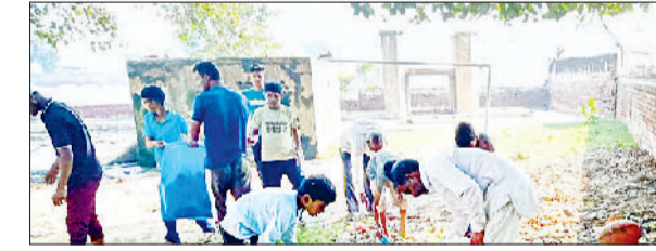
हिसार। गांव में सफाई अभियान चलते हुए।