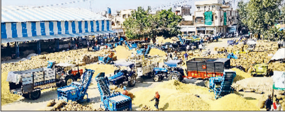
फतेहाबाद। मंडी में आई धान की फसल।

जिले की मंडियों और खरीद केन्द्रों पर धान की आवक जोरों पर है। जिले में अब तक 4 लाख 84 हजार 683 एमटी धान की आवक हो चुकी है। इसमें से करीब 61 प्रतिशत यानि 2 लाख 92 हजार 246 एमटी धान की लिफ्टिंग हो चुकी है जबकि 1 लाख 89 हजार 437 एमटी धान अब भी मण्डियों व खरीद केन्द्रों पर पड़ा है। बता दें कि सरकार द्वारा ग्रेड ए धान का सरकारी रेट 2389 रुपये प्रति क्विंटल तय किया गया है।