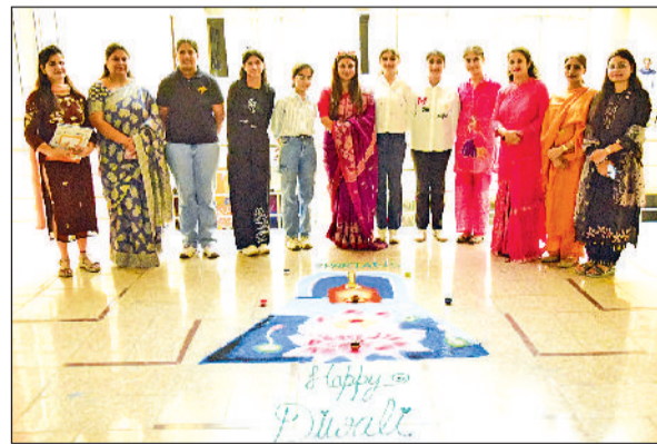
सिरसा। स्कूल में दीपावली पर्व मनाते हुए।

एसपी ने कहा कि दीपावली, गोवर्धन पूजा, भाई दूज और विष्टकमा जयंती जैसे प्रमुख त्योहारों के अवसर पर जिले में कानून-व्यवस्था बनाए रखने, अपराधों पर अंकुश लगाने और आमजन की सुरक्षा को लेकर पुलिस प्रशासन सतर्क और सक्रिय है। बिना नंबर प्लेट वाले वाहनों को ईंधन देना अपराध में परोक्ष सहयोग माना जाएगा। एसपी पेट्रोल पंप संचालकों को निर्देश दिए गए हैं कि वह सीसीटीवी कैमरे अनिवार्य रूप से लगाएं, जो 24 घंटे कार्यशील रहें और कम से कम 60 दिनों की रिकॉर्डिंग सुरक्षित रख सकें।