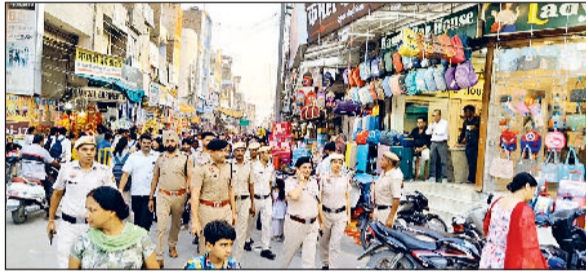
सिरसा। शहर में गश्त करती पुलिस।