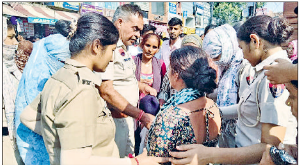
हिसार। बिछड़ी बच्ची को परिजनों के सुपुर्द करती पुलिस टीम।

लड्डियों से सजाया गया। इस दौरान ध्यान सत्र में साधकों ने अपने भीतर गहरते उतरते हुए अस्तित्व के साथ लयबद्ध होने का अनुभव किया। सभी साधकों ने एक-दूसरे को दीपावली की बधाई दी और खुशी का इजहार किया। सांस्कृतिक कार्यक्रम के सत्र में साधकों ने सतगुरु ओशो के भजन गाए और नृत्य करते हुए सभी को झूमने के लिए मजबूर कर दिया। कई साधकों ने गीत व कविता की प्रस्तुति देकर माहौल को खुशनुमा बना दिया। ध्यान महोत्सव के समापन पर साधकों के लिए भोजन की समुचित व्यवस्था भी की गई।